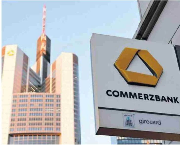
La sede di Commerzbank a Francoforte