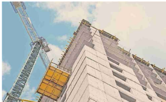
Al centro. Le coop emiliano-romagnole hanno costruito ospedali, ferrovie, quartieri