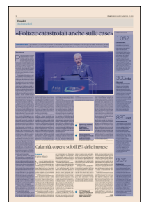
Peso: 1-3%, 26-61%

Il presente documento non è riproducibile, e' ad uso esclusivo del committente e non e' divulgabile a terzi.