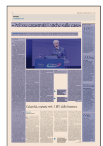
Peso: 1-3%, 26-61%