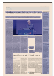
Peso: 1-3%, 26-61%

I danni causati dal ciclone Harry che ha colpito Sicilia, Sardegna e Calabria a gennaio 2026, erano dovuti