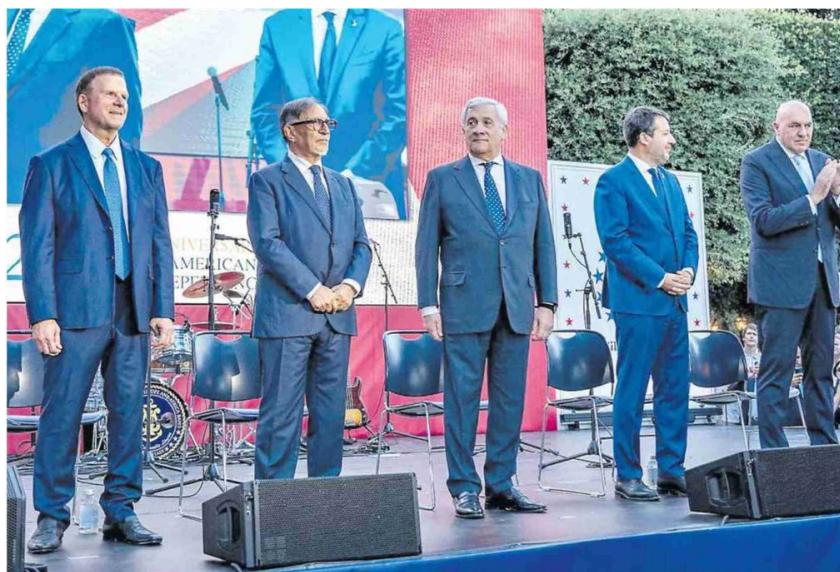
Sul palco allestito a Villa Taverna, da sinistra, l'ambasciatore statunitense Tiltan Fertitta, il presidente del Senato Ignazio La Russa, il vicepremier Antonio Tajani e Matteo Salvini, il ministro della Difesa Guido Crosetto

TRA I LEADER DEL CENTROSINISTRA PRESENTE SOLTANTO RENZI: «250 ANNI DI STORIA VALGONO PIÙ DEGLI ULTIMI DUE ANNI»