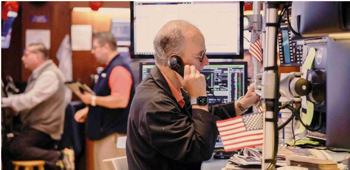
Mercati e Ai. La corsa dei listini americani ha segnato anche i primi sei mesi del 2026

Al via le trimestrali: per marzo-giugno 2026 FactSet stima utili in crescita del 23,1%, dal 18,8% previsto a marzo