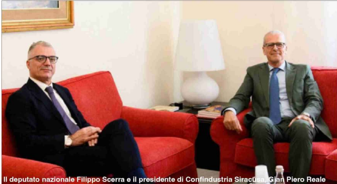
Il deputato nazionale Filippo Scerra e il presidente di Confindustria Siracusa, Gian Piero Reale

costruire una strategia condivisa che garantisca investimenti di qualità, sostenibilità ambientale e sviluppo per le future generazioni”, conclude Scerra.