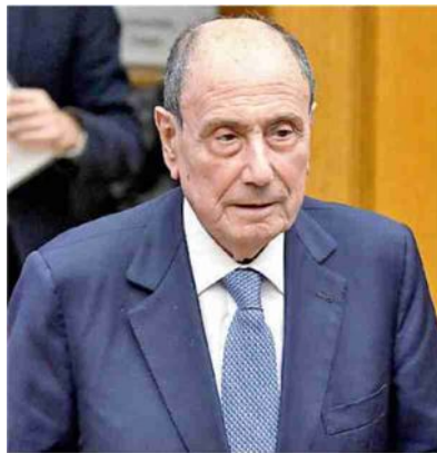
➤ Renato Schifani

re conquistato Messina a loro toccherebbe anche Catania. Da Palazzo d'Orleans il ragionamento è diverso: dopo il passo indietro di Schifani davanti al nome di Annalisa Tardino scelto dal ministro Salvini per Palermo e la nomina di un meloniano come Francesco Rizzo sullo Stretto, Catania non può che toccare al partito del governatore che al momento è anche quello di maggioranza relativa. Un muro contro muro che sembra in un momento di stallo ma che dovrà sbloccarsi al massimo fra una settimana quando scadrà la proroga come commissario dell'uscente Francesco Di Sarci-