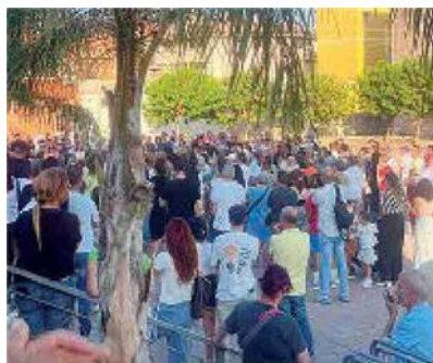
Due momenti del sit-in contro i miasmi che si registrano da oltre un mese