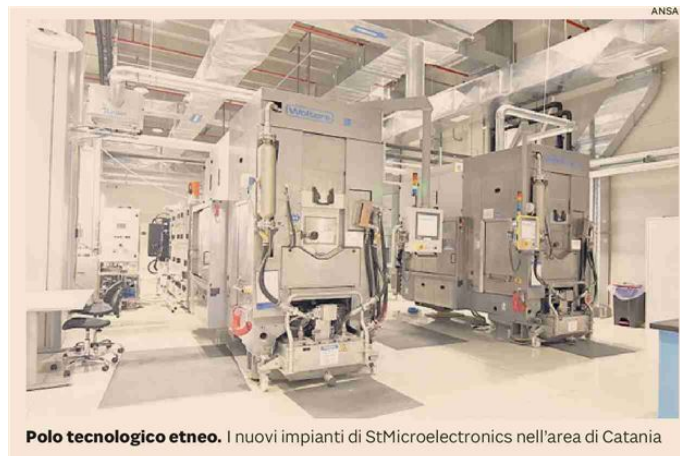
Polo tecnologico etneo. I nuovi impianti di StMicroelectronics nell'area di Catania