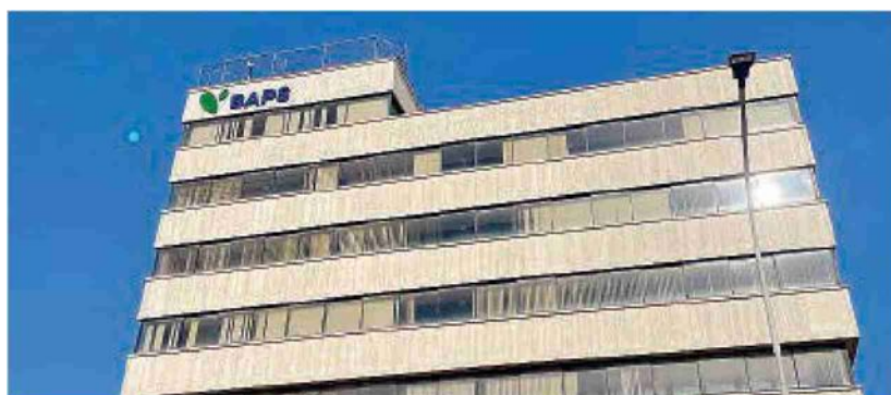
La sede della direzione generale di Baps a Ragusa