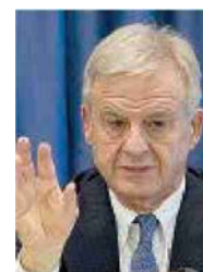
Corrado Clini, consulente del governatore Schifani e ministro dell'Ambiente del governo Monti