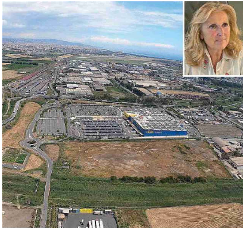
Per Catania 50 milioni di investimenti sulla zona industriale