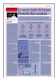
Peso: 1-2%, 17-87%

«L'umiltà è una virtù stupenda, il guaio è che molti italiani la esercitano nella dichiarazione dei redditi», diceva Giulio Andreotti, uno che la sapeva lunga. L'analisi sui dati pubblicati dal Mef nel 2025 mostra che, rispetto alla congruità delle dichiarazioni, sono sotto soglia il 25% di studi medici e laboratori, il 37% delle farmacie, il 48% dei dentisti, il 37% dei notai. Le attività di intermediazione e consulenza finanziaria e assicurativa: il 68% non raggiunge la sufficienza nei punteggi Isa e dichiara 125 mila euro contro i 568 mila di quelli con dichiarazioni attendibili. Gioiellerie: il 55% sostiene di guadagnare solo 28 mila euro, il 58% dei balneari dichiara di vivere con 15