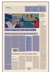
Peso: 1-3%, 6-52%

Il presente documento non è riproducibile, e' ad uso esclusivo del committente e non e' divulgabile a terzi.