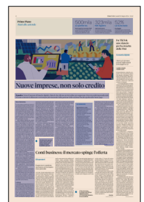
Peso: 1-3%, 6-52%

Per Qonto, soluzione di gestione finanziaria che affianca oltre 600 mila Pmi e professionisti in otto Paesi (è attiva in Italia dal 2019), tutti i piani prevedono la fatturazione elettronica (creazione, invio tramite SDI e tracciamento pagamenti), l'accesso dedicato per il commercialista (profilo in sola lettura per estratti conto e giustificativi), l'integrazione con software gestionali e il controllo centralizzato per la gestione delle spese del team.