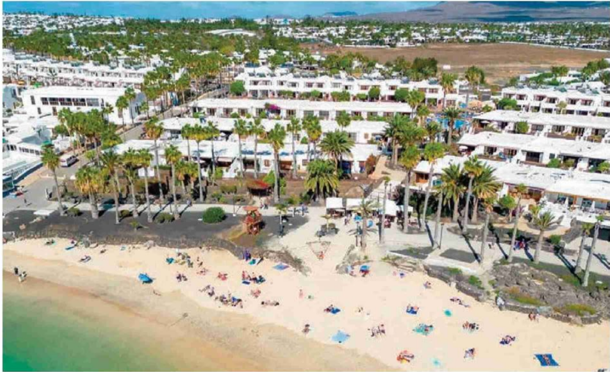
Isole Canarie al primo posto in europa per pernottamenti