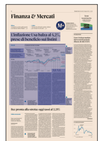
Peso: 1-1%, 26-36%

L'attenzione si sposta ora in Europa. Oggi è infatti attesa la decisione della Banca centrale europea. «Ci aspettiamo che la Bce alzi il suo tasso di riferimento di 25 punti base al 2,25%, in linea con la guidance fornita