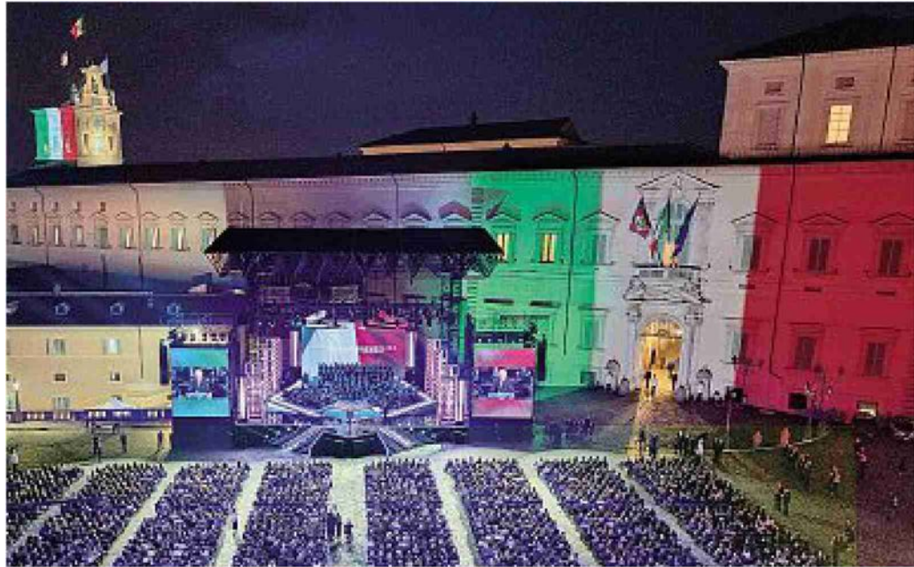
La festa per gli 80 anni della Repubblica nella piazza del Quirinale, con il presidente Mattarella applaudito a lungo

La Repubblica nasce dalla scheda piegata in una cabina, un gesto semplice e insieme rivoluzionario