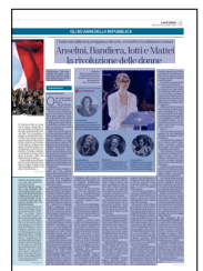
Peso: 1-2%, 13-72%

Ecco, queste ultime promesse non sono state ancora mantenute. Dobbiamo lavorarci. Dico "dobbiamo" perché se è vero che la sovranità appartiene al popolo allora ogni citta-