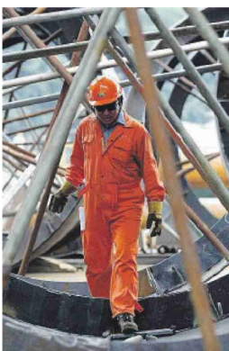
FABBRICA Un operaio al lavoro

CAMBIA L'IMPIEGO Per l'Istat l'Italia non ha soltanto perso occupazione industriale ha mutato struttura produttiva con una quota significativa del lavoro spostata dalla manifattura verso servizi ad alta intensità di lavoro ma con una crescita modesta della produttività