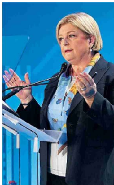
Marina Calderone Ministra del Lavoro e Politiche sociali

del Paese. «Un andamento positivo per il trend di crescita dell'occupazione femminile nel Mezzogiorno - continua Calderone - che va letto anche in funzione della consueta maggiore presenza di lavoratrici dipendenti nelle attività imprenditoriali guidate da donne. L'incentivo per l'autoimpiego al Sud si candida a diventare un virtuoso esempio di alleanza positiva tra lavoro autonomo e dipendente e di un sistema economico che ha fiducia nel futuro».