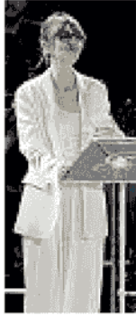
Sul palco Paola Cortellesi, 52 anni