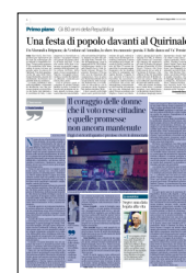
Peso: 1-2%, 4-60%