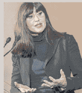
ANNA MARIA BERNINI Ministra dell'Università e della Ricerca