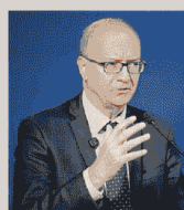
GIUSEPPE VALDITARA Ministro dell'Istruzione e del Merito