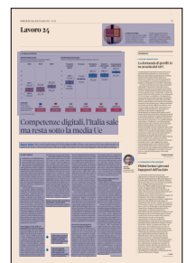
Peso: 1-1%, 25-56%

Il presente documento non è riproducibile, e' ad uso esclusivo del committente e non e' divulgabile a terzi.