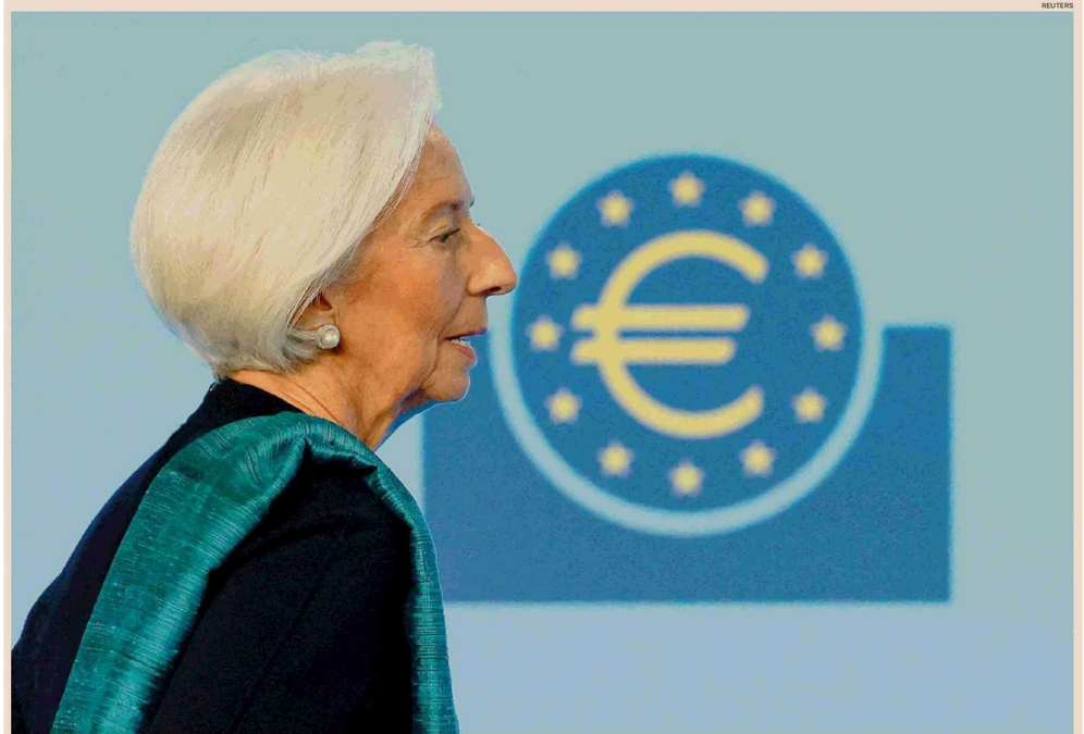
Verso la decisione sui tassi. Christine Lagarde, presidente della Banca centrale europea, domani deve definire il costo del denaro per l'Eurozona

Il tasso netto di stretta operata dalle banche nei confronti del credito al consumo e altre forme di prestito alle famiglie. Gli istituti di credito hanno ristretto i criteri interni e quelli per l'approvazione dei prestiti