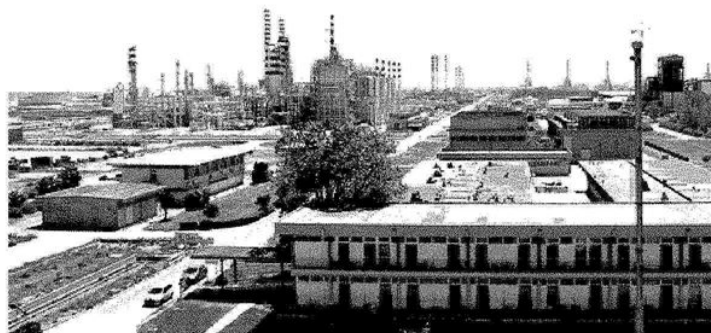
Il polo. Circa 2.500 lavoratori coinvolti nella filiera

IL SOLE 24 ORE, 28 APRILE 2026, P. 16 Sul Sole 24 Ore di ieri le richieste di sindacati e Regione per il polo di Brindisi