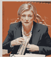
MARINA CALDERONE Ministro per il Lavoro e le Politiche Sociali