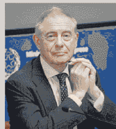
ADOLFO URSO Ministro delle Imprese e del Made in Italy