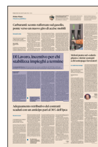
Peso: 1-2%, 5-21%

Prorogati i bonus per sostenere le assunzioni di giovani, donne svantaggiate e la Zes unica