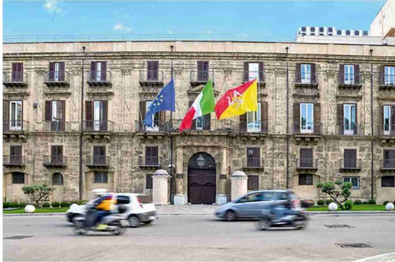
Palazzo d'Orleans, sede della presidenza della Regione siciliana