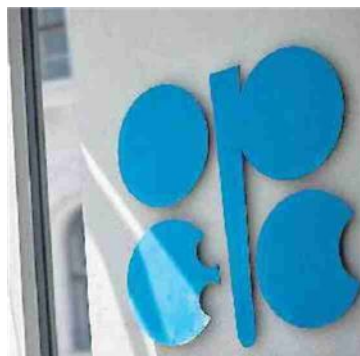
La sede dell'Opec a Vienna