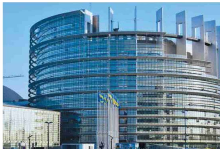
La sede di Strasburgo dell'europarlamento

pesca e acquacoltura nell'Ue, e gran finale l'attuazione della direttiva sul trattamento delle acque reflue urbane e rischi per la sicurezza dell'approvvigionamento di medicinali. La politica non si ferma, insomma.