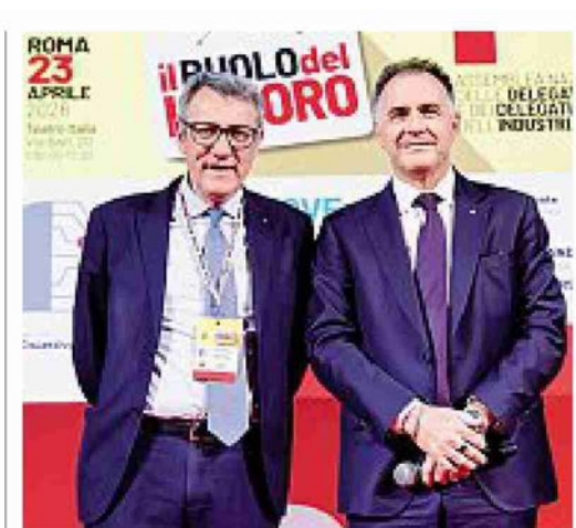
Da sinistra: il segretario generale della Cgil Maurizio Landini e il presidente di Confindustria Emanuele Orsini

Rischiamo una situazione peggiore di quella del Covid Landini Paghiamo l'energia 2-3 volte più degli altri in Europa Orsini