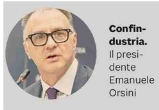
Confindustria. Il presidente Emanuele Orsini