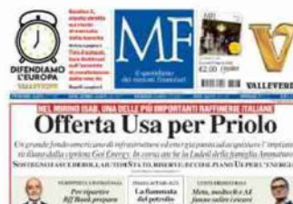
Così ieri la prima pagina di MF-Milano Finanza

Resta da vedere se gli americani si ritireranno in buon ordine o seguiranno le trattative a distanza tenendosi pronti a rilanciare. Inoltre, il fondo si farebbe affiancare da un grande gruppo energetico indonesiano, che è quasi automatico individuare nel campione nazionale Pertamina. Certo è che, anche dopo la cessione a Goi da parte dei russi di Lukoil, la raffineria più grande d'Italia, con la sua capacità giornaliera di 320 mila barili e una quota di circa il 20% della produzione nazionale, non smette di riservare sorprese. (riproduzione riservata)