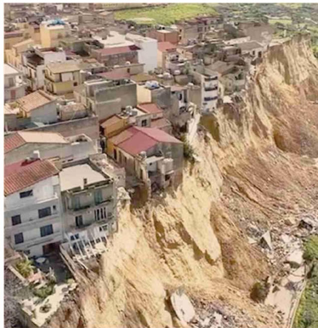
Frana di Niscredi. L'evento del paese siciliano è il simbolo del governo che non c'è

La Regione siciliana ha varato un secondo piano da oltre 1,6 miliardi per ciclone Harry e frana di Niscredi