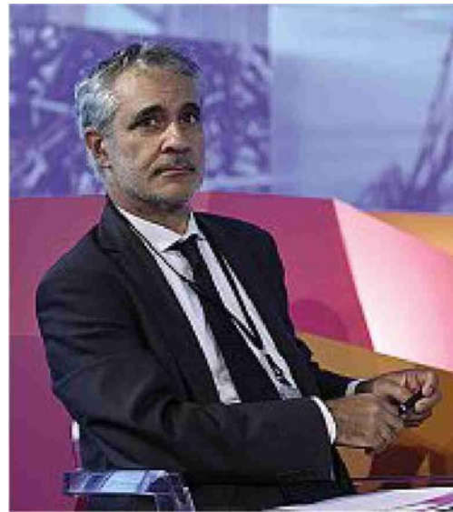
Stefano Scarpetta, capo economista dell'Organizzazione per la Cooperazione e lo Sviluppo Economico

Le accise sono imposte applicate su prodotti considerati strategici, come carburanti, energia, alcolici e tabacchi. Non seguono l'andamento dei prezzi: sono tasse fisse, calcolate sulla quantità, e finiscono direttamente nel costo finale pagato dal consumatore. In Italia rappresentano una voce storica del gettito pubblico, nate spesso per far fronte a emergenze e poi rimaste come entrata stabile. È anche per questo che il loro peso sui carburanti torna ciclicamente al centro del dibattito.