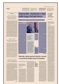
Peso: 1-2%, 12-24%

AL PAPA Il Presidente ha inviato un messaggio al Papa per il suo rientro. «Il suo invito alla pace è un richiamo per tutta la comunità internazionale»