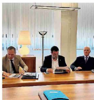
Recchi e Ciucci Con Salvini