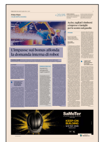
Peso: 1-2%, 3-36%

A salvare il comparto in questo primo scorcio dell'anno, in modo inatteso, è però la domanda internazionale, che dopo mesi di difficoltà si ripresenta tonica, con un rialzo delle commesse di quasi 29 punti, abbastanza per portare in terreno positivo la raccolta ordini totale della categoria, che tra gennaio e marzo cresce nel complesso di tre punti. «L'estero va - conclude Rosa - ma ancora per quanto? E nel frattempo l'Italia è ferma al palo in balia delle comunicazioni delle autorità di governo. Ma cosa accadrebbe se il con-