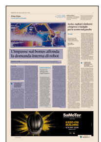
La frenata. Nel primo trimestre del 2026 Ucimu registra un calo vicino al 30% per le commesse raccolte dai costruttori di macchine utensili in Italia