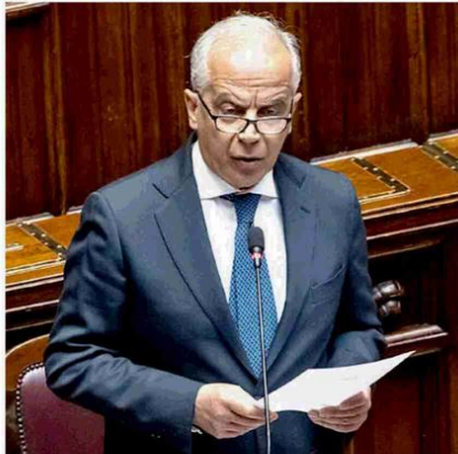
➔ Matteo Piantedosi, ministro dell'Interno, in alcuni momenti della discussione sul di Sicurezza ieri alla Camera