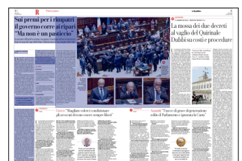
Peso: 1-6%, 10-50%

Il Consiglio nazionale forense ha preso le distanze dalla norma. L'Associazione nazionale magistrati ha condiviso i timori degli avvocati sul diritto di difesa libera dell'assistito