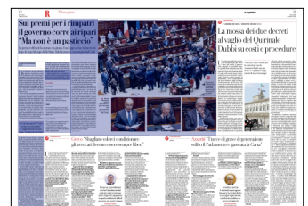
Peso: 1-6%, 10-50%

Tensioni e pressing si consumano dietro le stanze felpate, il garbo di rito, le interlocuzioni dei tecnici. Una sfida lanciata al Colle sui nodi nevralgici di sicurezza e migranti, e di cui nessuno conosce, fino in fondo, l'esito. Intanto il ministro dell'Interno Piantedosi ricompare finalmente in aula, teso, a rivendicare «la priorità politica» del decreto. E la premier si mostra serena, ma a distanza: solo «rilievi tecnici», ne terranno conto. Traduzione: avanti tutta. Mentre il vicepremier Salvini ha un'alzata di spalle che colpisce, e dice tutto del clima. Il no del Colle?