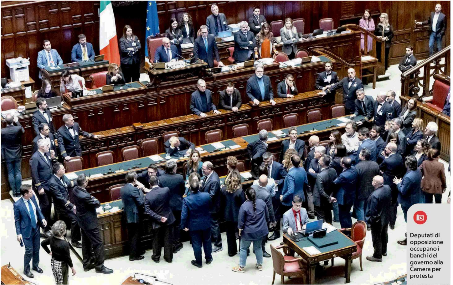
Deputati di opposizione occupano i banchi del governo alla Camera per protesta