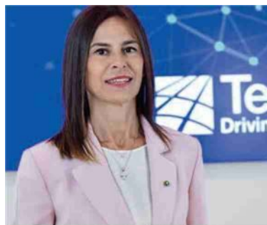
Giuseppina Di Foggia, AD e DG di Terna