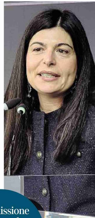
La presidente Chiara Colosimo. 39 anni. FdI