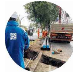
L'intervento Consentirà di demolire circa 50 km di linee aeree e di liberare 145 ettari di aree

I cittadini, e in particolare i proprietari delle particelle interessate, potranno consultare la documentazione progettuale presso gli uffici della Regione Siciliana e dei Comuni coinvolti. La documentazione sarà inoltre disponibile online tramite il link indicato nell'avviso.