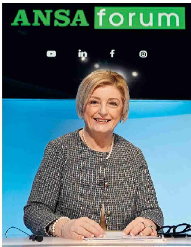
Forum con la ministra Ha risposto alle domande dell'Ansa