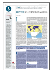
Peso: 1-9%, 30-23%

Sono stati invece bocciati i due referendum